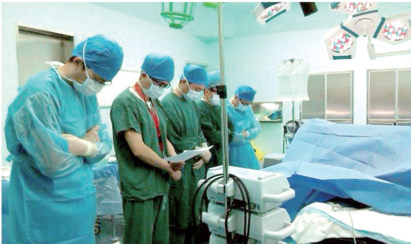
手术室内医护人员向捐献者致敬 资料图片