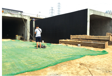
3孔箱涵已有两孔正在顶进

作为我市十大畅通工程之一,金水路西延工程对缓解市区东西向通行压力有巨大作用。因在铁路河流间穿行,对城区交通影响很小,该工程在十大畅通工程中最为低调。