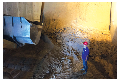
一辆钩机正在运卸泥土