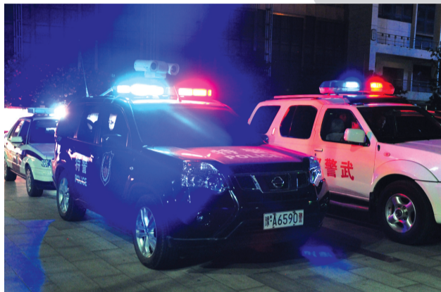
多警种联合行动打击“飙车”

近日起，郑州警方在全市范围内启动为期半年的整治“飙车”交通违法行为专项行动。行动期间，警方交警、刑侦、治安、特警、属地分局等警种部门将集中警力、合成作战，重拳打击整治“飙车”违法行为，有效遏制其发展蔓延。