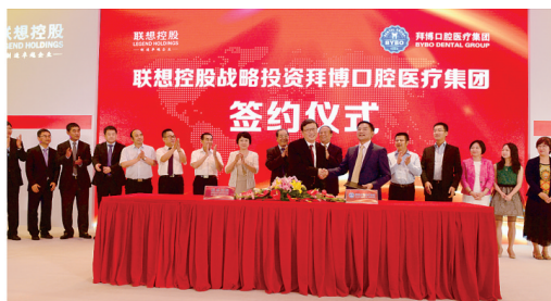
联想10亿助力拜尔种植牙