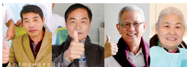
我们是拜尔种植牙见证者！

众多河南缺牙者见证着一个个拜尔水激光种植牙奇迹的发生，免受缺牙之苦，喜逢重生奇迹。拜尔水激光种植牙在2015年悄然成了绿城人心照不宣的种牙除病长寿秘诀。