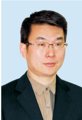
田龙 郑州名仕男科医院特邀专家、中国第一个男科博士后、美国康奈尔大学常年学术交流专家