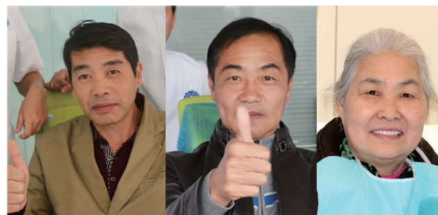
“我们是拜尔种植牙见证者”