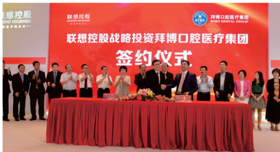
联想10亿助力拜尔种植牙