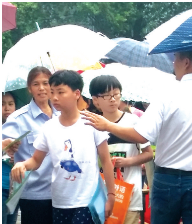
27日下午，在省实验文博学校内，家长冒雨陪着孩子前来测试。

近4万小学毕业生参加了6月27日、28日举行的市区民办初中“小升初”阶段性评价。和之前预测的情况类似，热点民办初中的参评学生和招生计划的比例高达14:1。同时，备受关注的阶段性评价工具（大家通常说的评价题目）也通过各种渠道被展示出来。虽然没有了类似去年的“病狗”题，不过一道“盲人摸瓜”的题目又火了。