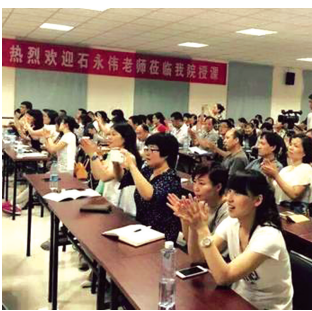
讲座现场气氛热烈