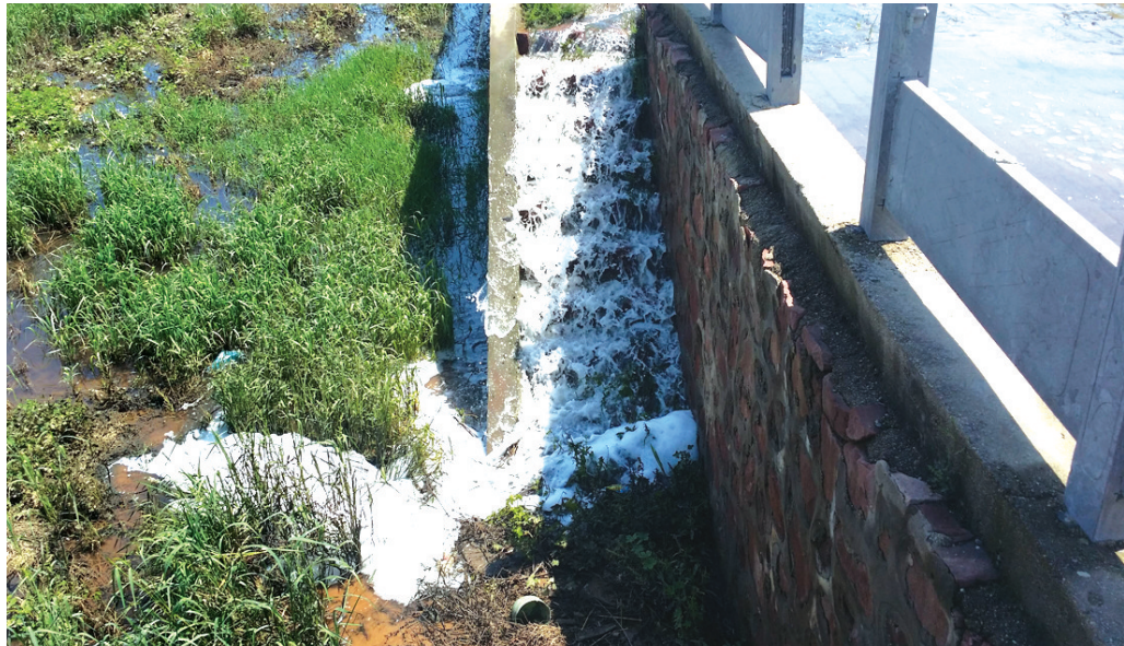
须水河畔,污水直排进河道

昨日,化工路附近的须水河区域,堤岸上大量污水倾泻直排进河道,而沿河道路也因此出现塌陷情况,引来不少微博网友关注转发,水务部门称市政管网出现堵塞,将采取措施进行疏通,避免沿河设施受到损害。