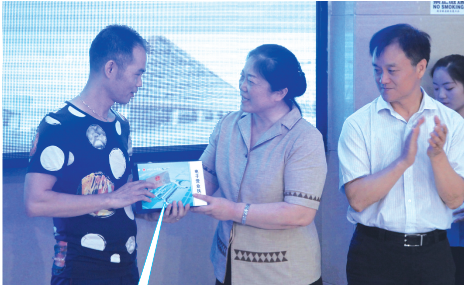
法人领到企业电子营业执照