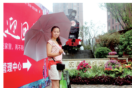
和家门口的美景合个影吧