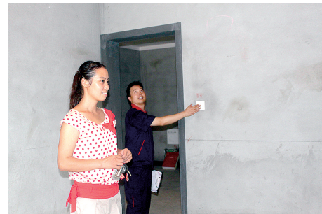
物业人员介绍房屋管线布局