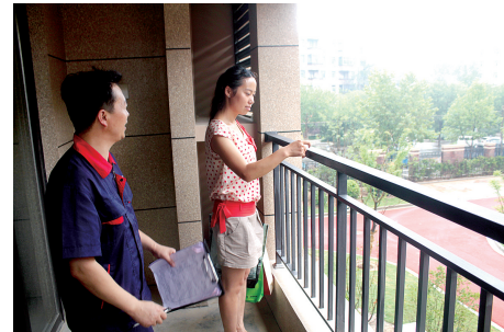
站在阳台上即可望到绿意盎然的小区