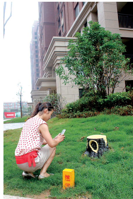
树桩形状音响播放着欢快的音乐