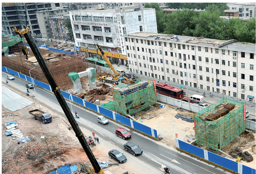
昨日上午,文化路以东的农业路高架桥墩大部分都已经竖起。