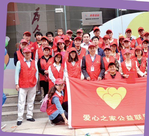
爱心之家联盟 部分成员合影

俗话说,远亲不如近邻。随着城市发展脚步的加快,老社区里盖起了高楼大厦,老邻居们也从胡同平房搬进了新式小区,人与人之间的距离似乎越隔越远,但只要您用心观察,温馨感人的邻里故事仍在千家万户默默上演着。即日起,本报发起“夸夸咱的好邻居”活动。只要您身边有热心人、好心人、关心社区事务的人,只要您的邻里关系融洽、相互帮扶、亲如一家,都可以拿起电话告诉我们,把温馨的故事分享给大家,把普通人的正能量传递给社会。线索征集热线:96678 本版记者 柴琳琳 通讯员 陈宝文/图