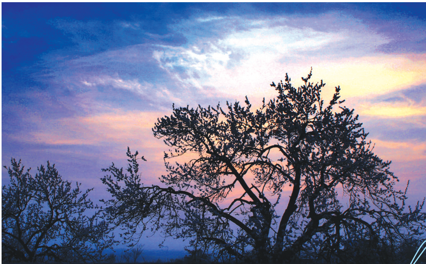
黄昏时樱桃沟内的古树

人活一世,草木一秋,不朽的已成为传奇,不死的千年古树不能不说是一个神话。在樱桃沟行政村驻地南约300米处,就有这么一棵树,它历经朝代的更迭、世事的沧桑,依旧郁郁葱葱,生机勃勃,是历史最好的诉说者。