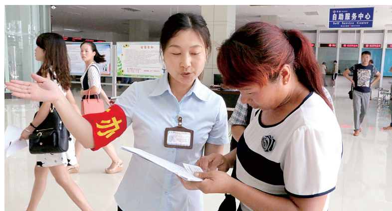
有什么不懂的地方,可随时问导办员。

“精彩活动”将定期向广大用户推出一系列公益、精彩活动,让大家在参与中感受公益,在活动中享受精彩。