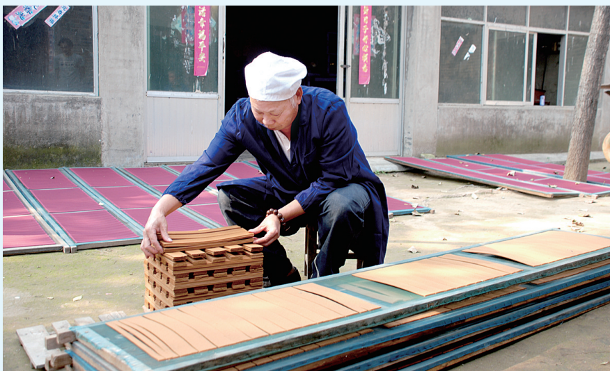
耿氏香传人正在制作耿氏香