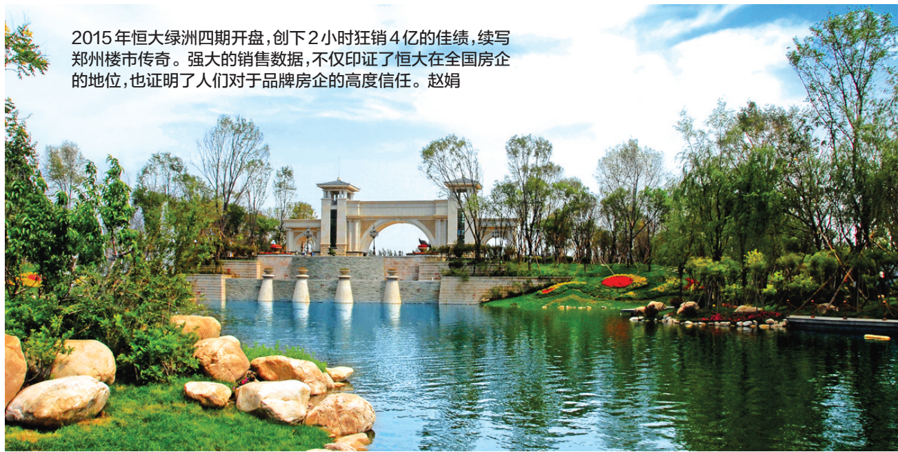
2015年恒大绿洲四期开盘,创下2小时狂销4亿的佳绩,续写郑州楼市传奇。强大的销售数据,不仅印证了恒大在全国房企的地位,也证明了人们对于品牌房企的高度信任。赵娟

时光回溯,2013年恒大绿洲一期以非凡的品质和超高的性价比赢得了众多客户的认可和推崇,创造了短短100余天即售罄的佳绩;辉煌积淀,全新出发。2014年恒大绿洲巅峰不止步,相继推出二期、三期新品,除了继续为业主奉送每平方米1500元精装修之外,还推出首付分期优惠政策圆业主拎包入住之梦,并获得郑州楼盘销售双冠王的佳绩;2015年恒大绿洲四期开盘,创下2小时狂销4亿的佳绩,续写郑州楼市传奇。强大的销售数据,不仅印证了恒大在全国房企的地位,也证明了人们对于品牌房企的高度信任。