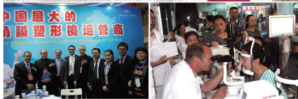
中国最大的角膜塑形镜运营商