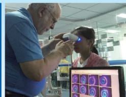
上海麦康益视光学科技发展有限公司委托发布