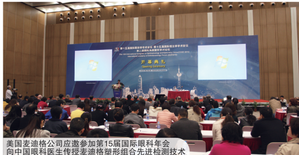
美国麦迪格公司应邀参加第15届国际眼科年会 向中国眼科医生传授麦迪格塑形组合先进检测技术

麦迪格塑形组合实现了矫治量大于用眼量，解决了近视矫治的关键难题。同时配合一种智能语音矫姿系统及光源防护体系，实现了一种综合疗法，使麦迪格塑形组合技术成为世界上独一无二的近视矫治选择。