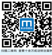
扫描二维码 查看十余万成功矫治案例