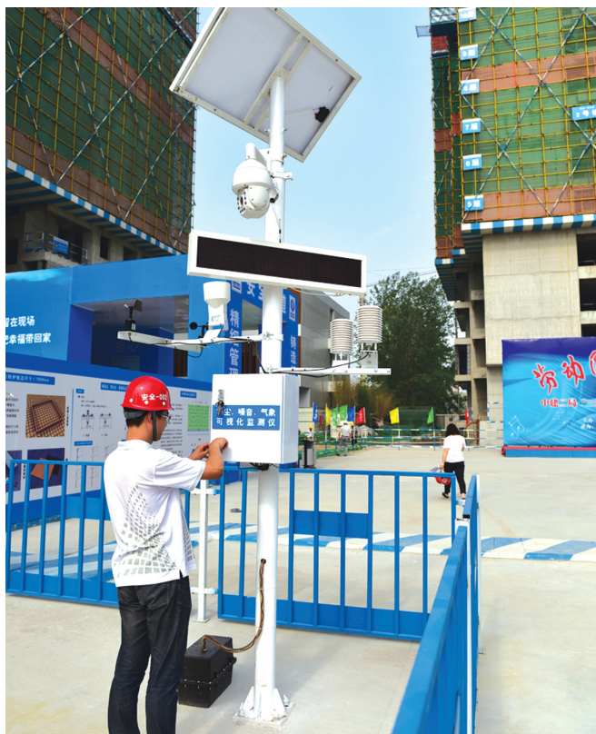
工作人员在保养监测仪

文劳路和信息学院路交叉口的东润·泰和苑项目部,有一个新型“武器”,可以实时监测PM10。当PM10浓度达到一定数值时,喷淋设备就会自动洒水,同时,设备将通过手机软件发信息给管理人员。