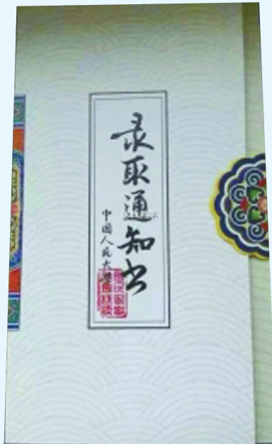
AA05 去年人大录取通知书