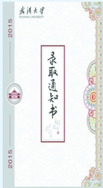
今年武大录取通知书