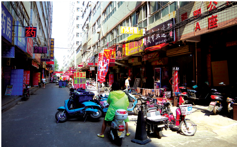
陈寨一条主街道被临街商户占用去一半