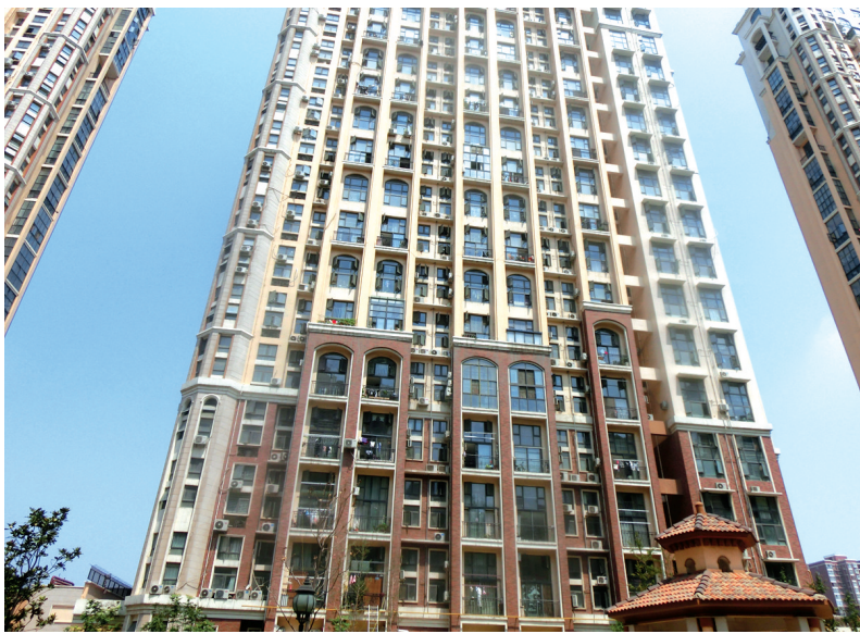
托斯卡纳小区停电楼上窗户全开着通风

昨日上午11时许,在北三环与电厂路交叉口西南角的托斯卡纳小区,院内都是满脸无奈的居民。上点年纪的男士多光背,其他大人小孩,都在各自寻找小区内诸如地下停车场出入口处或树荫下躲避。一群老太太手里拿着纸片或扇子不停给自己或身边的小孩扇风。