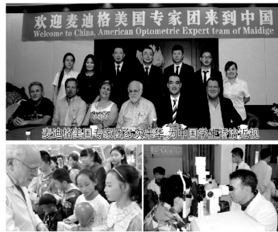
欢迎麦迪格美国专家团来到中国 Welcome to China, American Optometric Expert team of Midege

麦迪格塑形组合实现了矫治量大于用眼量，解决了近视矫治的关键难题。同时配合一种智能语音矫姿系统及光源防护体系，实现了一种综合疗法，使麦迪格组合技术成为青少年近视矫治的最佳选择。