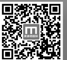
扫描二维码 查看十余万成功矫治案例