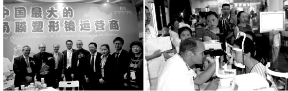
中国最大的角膜塑形镜运营商

入入光线改变成两条平行线，形成模拟望远状态，解除视疲劳，远离了近视产生的根源，巩固了近视矫治的效果。