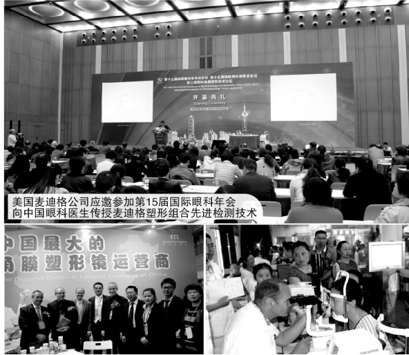
美国麦迪格公司应邀参加第15届国际眼科年会向中国眼科医生传授麦迪格塑形组合先进检测技术