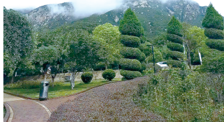
嵩山新雨后,松柏亦清新

用镜头记录并分享登封的美丽风情和风景名胜。5月21日,本报“美丽登封随手拍”摄影大赛活动启动后,社会各界纷纷响应,登封各网站也都表示支持本活动。