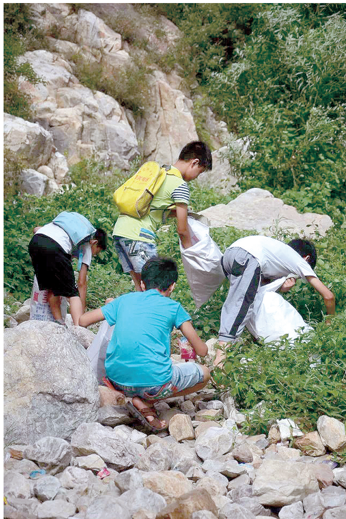
小志愿者在八龙潭捡拾垃圾 23号登封美德

用镜头记录并分享登封的美丽风情和风景名胜。5月21日,本报“美丽登封随手拍”摄影大赛活动启动后,社会各界纷纷响应,登封各网站也都表示支持本活动。