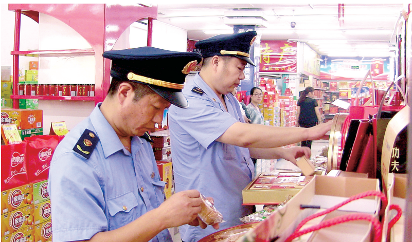
荥阳市工商行政管理局工作人员到超市查验商品