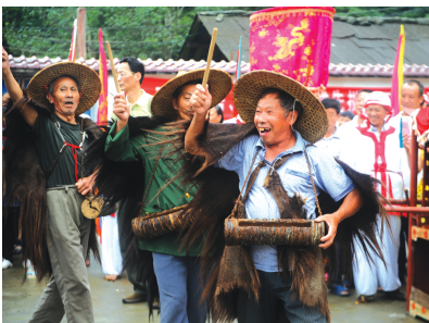
自制的道具、乐器等彰显传统文化气息