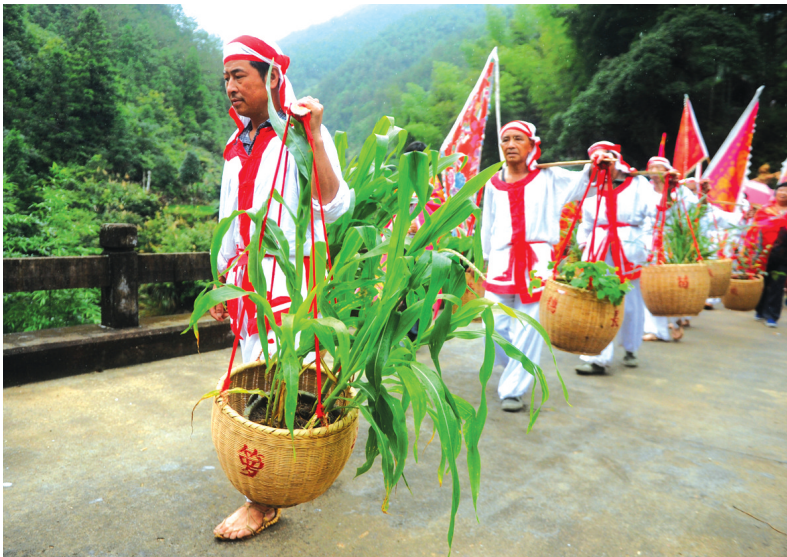
村民身着“当年红巾军”的服装巡游,以祈求无灾无病,稻谷丰收

“保苗节”是流传于浙江省衢州市开化县西部的一个传统庙会活动,包括抬轿、舞伞、挥旗、民乐等传统文化艺术形式,阵势庞大,人员众多,各种自制道具独具特色。在“全国知名媒体聚焦开化”新闻摄影交流活动中,郑州晚报记者记录了这种并不多见的传统庙会活动。