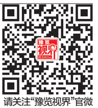
请关注“豫览视界”官微