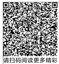
请扫码阅读更多精彩

“保苗节”源于元末年间,民间传说朱元璋当时带领红巾军在古田山休整,平坑村民多挑军粮相助,朱元璋非常感激。地处深山的平坑村民农田里的庄稼不时被山上下来的狗熊、野猪糟蹋,朱元璋非常痛心,忙派士兵驱熊赶猪,并把部队的旗帜满畝田插起来,以起到惊吓野兽的作用。从此以后,平坑村民便模仿起来,也做起三角旗插在畝田,并举行“保苗节”,纪念朱元璋和红巾军为他们驱兽保稻苗的功德,一直沿袭至今,成为当地的一项民间庙会。每年农历六月,村民身着“当年红巾军”的服装,抬着“古佛行香”,在村庄和畝田中巡游,据说凡巡游过的畝田都无灾无病,稻谷丰收。这也是一项民间传统文化项目,整个活动充满古老的传统文化色彩,表达了农民对美好生活的向往。热闹的场景,体现了农民恣肆狂舞、祈祷丰收的喜悦和憧憬。