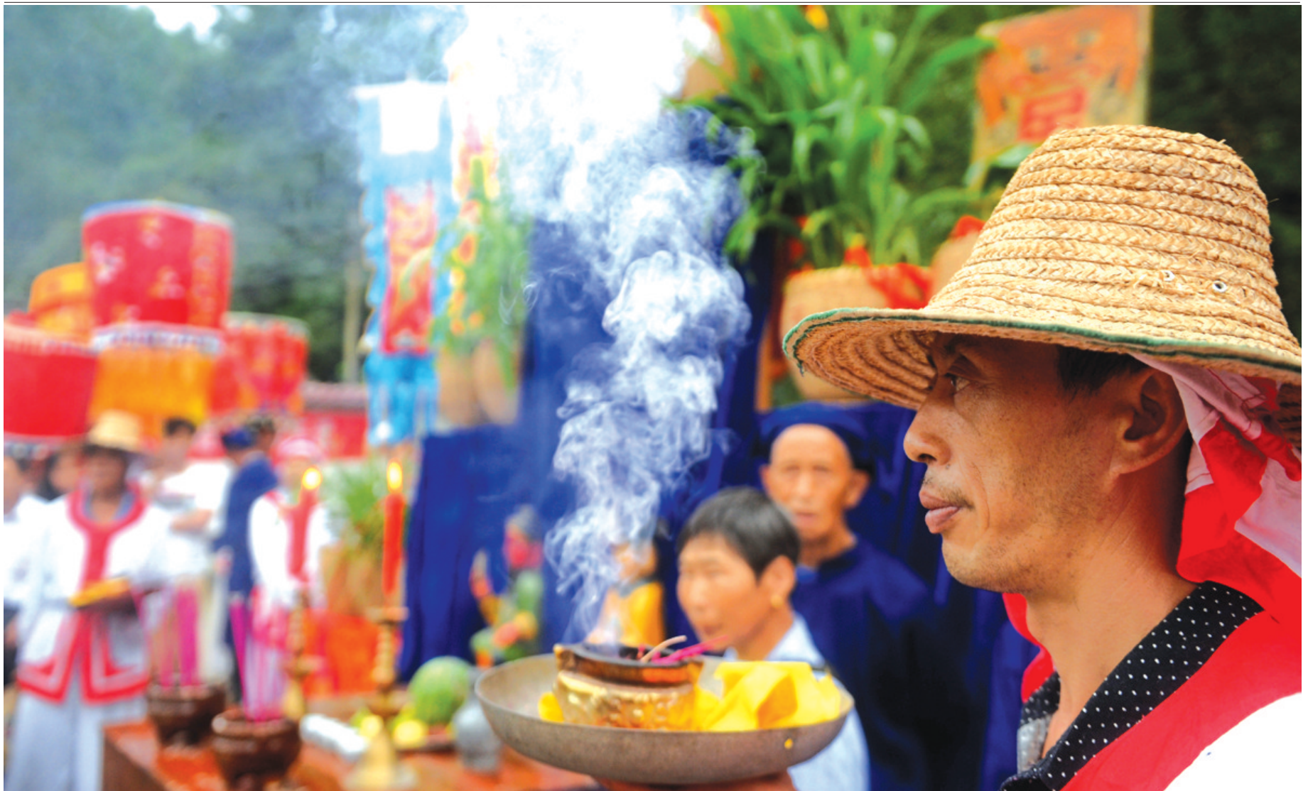
“古佛行香”巡游是“保苗节”仪式中的一个重要环节