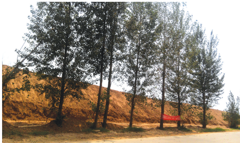
三十里铺陈庄村村内道路路边绵延的土山