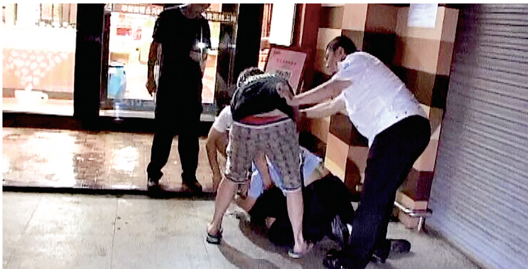
一男孩企图拉开民警让同伴脱困,巡防队员上前劝阻