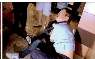
一名民警鼻子受伤流血