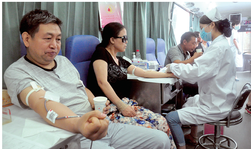
在采血车上献血的市民

8月6日上午,停放在紫荆山省人民会堂门口的一辆无偿献血车上悬挂着红色条幅:“炎炎夏日血液库存急剧减少,欢迎你参加应急献血。”