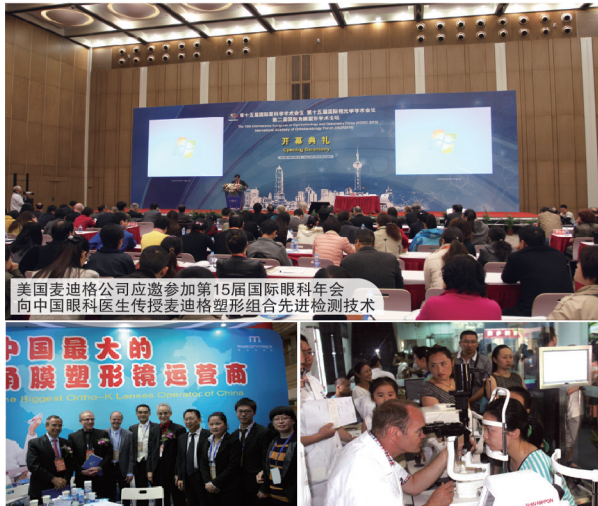
美国麦迪格公司应邀参加第15届国际眼科年会 向中国眼科医生传授麦迪格塑形组合先进检测技术

据Daniel Bell先生介绍，因为这种组合技术检查较为严格，所有数据都要经过美国专家的分析调整才能够达到最佳的矫治效果，所以目前只通过麦迪格200多家眼视光中心进行推广，短期内这种产品只能够在麦迪格才能购买到。