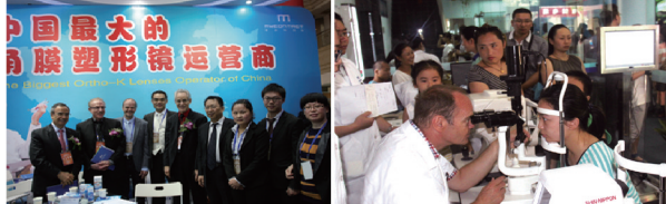
中国最大的角膜塑形镜运营商