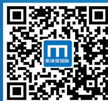
扫描二维码 查看十余万成功矫治案例