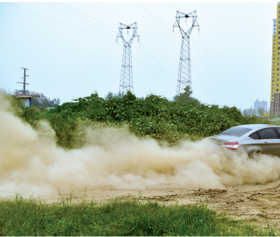
一辆小轿车经过,滚滚烟尘

“北三环电厂路口东南角,有一条道路扬尘太厉害了,堪称三环内扬尘最厉害的道路。”昨日,市民郭先生向本报投诉。