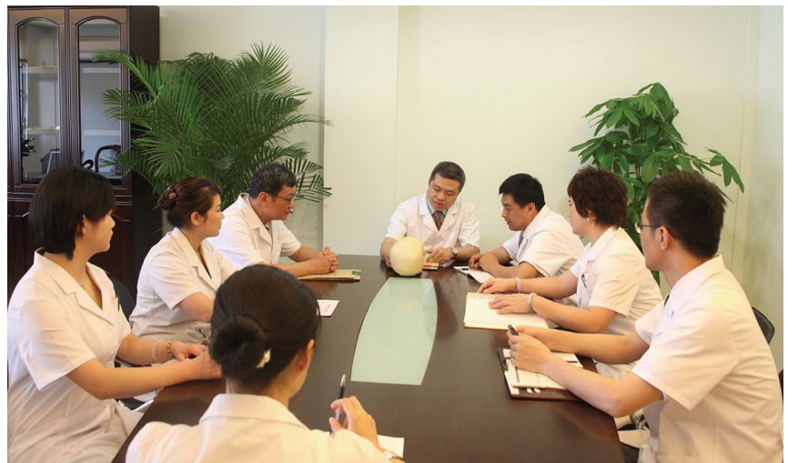
河南公安医院骨科名医会诊病例