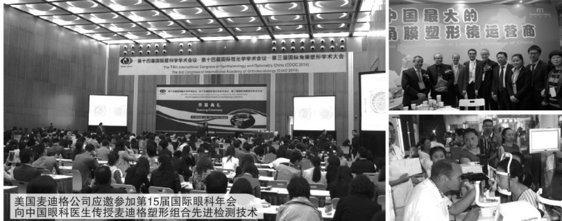
美国麦迪格公司应邀参加第15届国际眼科年会 向中国眼科医生传授麦迪格塑形组合先进检测技术

然而，今年很多暑期培训学校老师却惊奇的发现，很多学生的“小眼镜”都不见了！他们是怎么摘掉近视眼镜的呢？原来，他们都是在假期通过一种非手术的矫治技术摘掉了近视眼镜！为了让更多学生摘掉眼镜，我市7-25岁近视学生均可在暑假期间免费体验这种先进的近视矫正技术，仅剩6天！