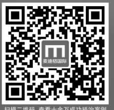
扫描二维码 查看十余万成功矫治案例