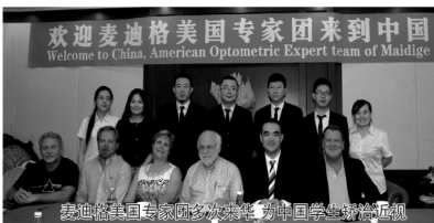
欢迎麦迪格美国专家团来到中国 Welcome to China, American Optometric Expert team of Maidige

组合是一种物理矫治方法，不会对眼睛及角膜带来任何伤害，他的安全性甚至高于普通隐形眼镜。对于长期效果来说，麦迪格塑形组合是专门针对中国学生用眼量大的问题而设计的，是角膜塑形镜的一种升级，这种组合矫治技术不仅可以使近视学生恢复正常视力，还会防止新的近视再次产生，控制近视度数不断增长”。