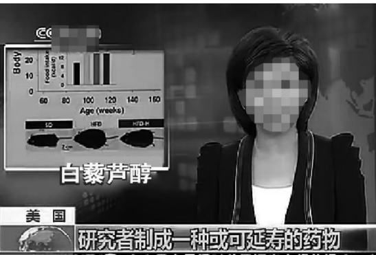
研究者制成一种或可延寿的药物

服用江中白藜芦醇,只需1小时,就能化开全身血栓,其溶栓效果是普通制剂的10倍。在化开血栓的同时,江中白藜芦醇还能抗血