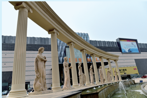
西四环西侧的一家市场很具有国际范儿

昨日,西四环与中原西路交叉口附近的家具、建材市场门口,紧挨西四环处放着一排花卉,一片生意盎然的样子。旁边就是市场大门,从门口的大字可以看出这里是一家企业建设的“家居CBD”。