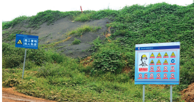
商登高速黄土覆盖