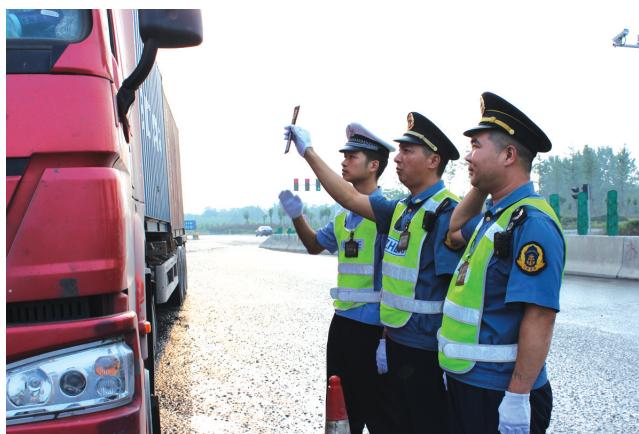
路政执法人员对超载车辆进行检查

散装货车沿途抛撒是造成道路扬尘的主要污染源,新密市交通运输局积极配合公安等部门开展道路运输综合整治,4月份以来,累计派出执法人员3900多人次,坚持昼夜执法,先后处理私自改型、超限超载、不按规范加盖篷布等散装货车违法违规车辆611台次,按照违法状态不消除不放过原则,全部整改到位。同时加大黄标车治理工作,对未取得绿色环保标志和尾气检测不合格的营运车辆,一律不予办理道路运输年度审验手续,不予发放《道路运输证》,确保营运黄标车辆全部治理到位。