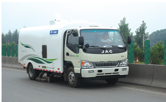
干式清扫车正在作业