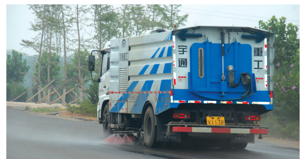
降尘式清扫车正在清洁道路

消除。截至8月15日,累计上报扬尘治理台账488份,下发整改通知书28份,消除扬尘污染点36处,为新密市推进大气污染治理打好了前站,为营造“郑州蓝”贡献了一份力量。