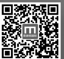
扫描二维码 查看十余万成功矫治案例