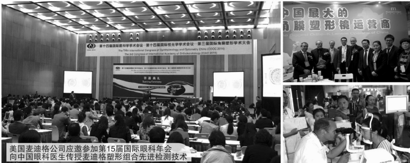
美国麦迪格公司应邀参加第15届国际眼科年会向中国眼科医生传授麦迪格塑形组合先进检测技术

然而，今年很多暑期培训学校老师却惊奇地发现，很多学生的“小眼镜”都不见了！他们是怎么摘掉近视眼镜的呢？原来，他们都是在假期通过一种非手术的矫治技术摘掉了近视眼镜！为了让更多学生摘掉眼镜，我市7~25岁近视学生均可在暑假期间免费体验这种先进的近视矫正技术，仅剩4天！