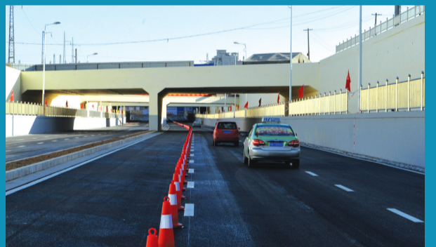
黄河路下穿铁路涵洞