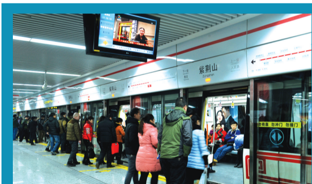
地铁1号线大大缓解市区中心东西方向主干道交通压力