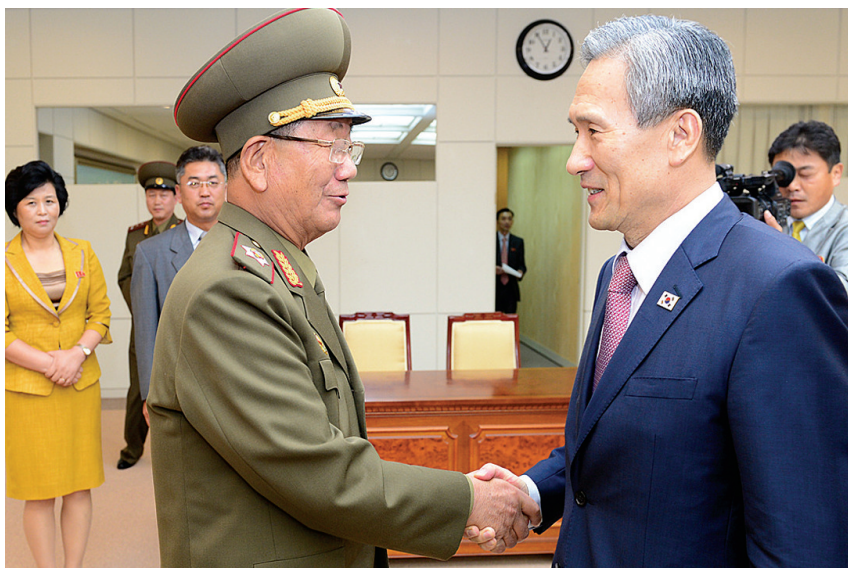
朝方代表黄炳誓(前左)与韩方代表金宽镇(前右)在会谈后握手。

8月25日,出席在韩朝边界板门店举行的朝韩高级别紧急接触的韩方代表青瓦台国家安保室室长金宽镇与朝方代表朝鲜人民军总政治局局长黄炳誓在会议结束后握手。据新华社电