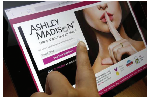
婚外情网站“阿什莉·麦迪逊”页面

上说,这起案件性质不同一般,“阿什莉·麦迪逊”网站数千会员个人信息遭曝光,堪称全球最严重数据泄露事件之一。