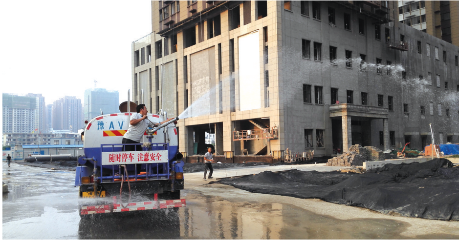
聂庄工地保洁保湿常抓不懈

金水区未来路街道办事处共有工地17处,其中在建工地6处,待建工地6处,市政道路建设工程工地3处,下穿隧道工程工地1处,拆迁工地1处。通过前期治理,未来路街道办已硬化路面6万平方米,绿化5万余平方米。以精细化管理理念,动态管理在建工地,以科学化统筹方法,源头治理大气污染,未来路街道办严格按照工地扬尘围挡屏障、洒水清扫、硬化绿化、车辆冲洗、覆盖遮挡、渣土运输等“6个100%”标准要求,通过“治污大招”,实现工地合格率100%。