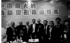
中国最大的角膜塑形镜运营商