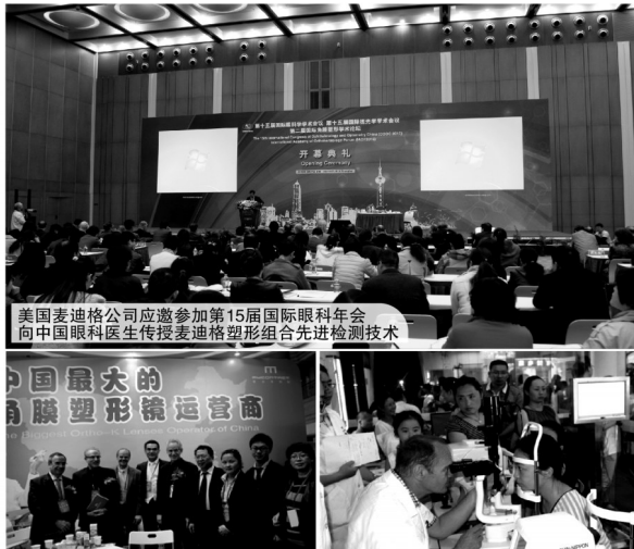
美国麦迪格公司应邀参加第15届国际眼科年会 向中国眼科医生传授麦迪格塑形组合先进检测技术