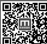
扫描二维码 查看十余万成功矫正案例