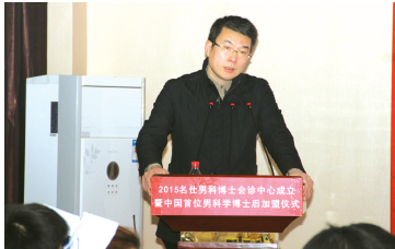
中国首个男科学博士后加盟郑州名仕男科医院,并进行显微外科相关学术讲座