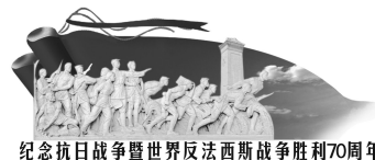
纪念抗日战争暨世界反法西斯战争胜利70周年

会议要求,下一步,各地慈善组织要进一步加快推进县、乡、村(含街道、社区)三级慈善组织网络建设,力争年底前全市基本建成比较健全的基层慈善组织网络。各县(市)区、开发区要建立健全基层慈善组织网络,围绕三级慈善组织上下联动、接力救助的格局,努力做到小灾小难救助不出村,群众心里有依靠,带动更多人加入到邻里互助的行列,有效形成上下衔接、左右相连、覆盖城乡、联络各行业的慈善工作网络格局。 郑州晚报记者 裴蕾