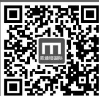
扫描二维码 查看十余万成功矫正案例