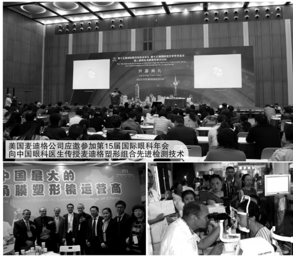
美国麦迪格公司应邀参加第15届国际眼科年会 向中国眼科医生传授麦迪格塑形组合先进检测技术