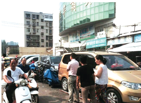
商户的车辆把中间的道路占满了。