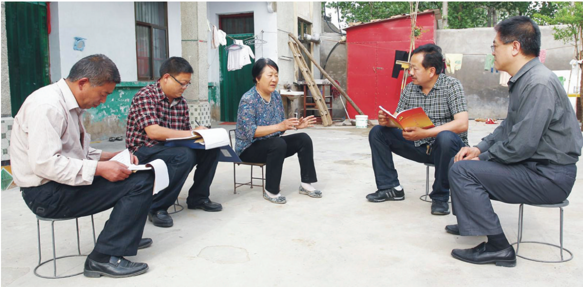
二三级网格长入户走访排查