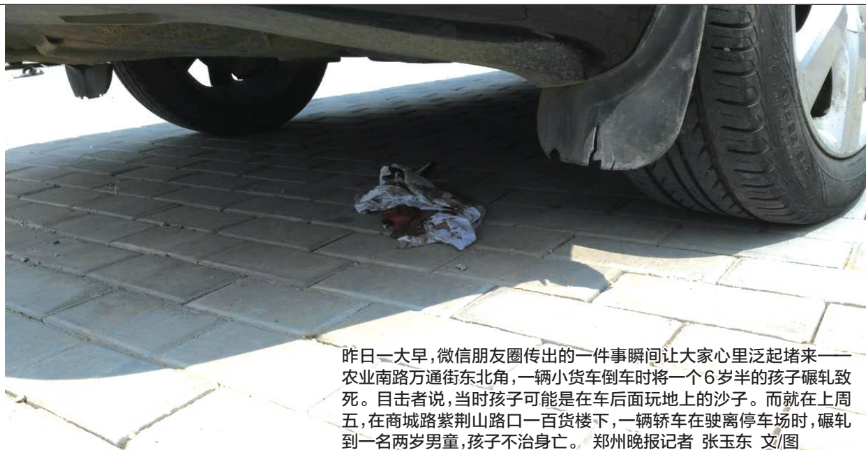
昨日一大早,微信朋友圈传出的一件事瞬间让大家心里泛起堵来——农业南路万通街东北角,一辆小货车倒车时将一个6岁半的孩子碾轧致死。目击者说,当时孩子可能是在车后面玩地上的沙子。而就在上周五,在商城路紫荆山路口一百货楼下,一辆轿车在驶离停车场时,碾轧到一名两岁男童,孩子不治身亡。