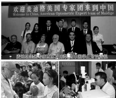
欢迎麦迪格美国专家团来到中国

答：这种组合技术是物理原理与光学原理的结合，非手术、无创伤，非常地安全。另外，配合麦迪格独有的远程角膜监测仪、双效速洁系统及完善的售后服务体系，完全可以确保安全。