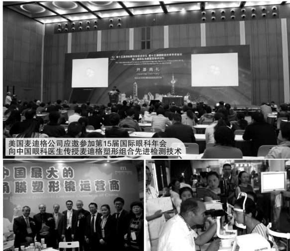
美国麦迪格公司应邀参加第15届国际眼科年会 向中国眼科医生传授麦迪格塑形组合先进检测技术