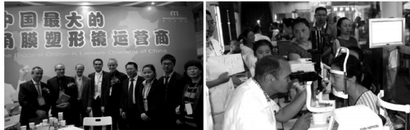
中国最大的角膜塑形镜运营商