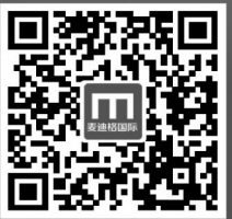
扫描二维码 查看十余万成功矫正案例