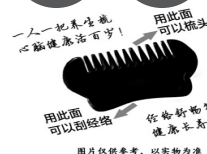
一人一把养生梳，头脑健康活百岁！ 用此面可以刮经络，作刮痧气疏通，健康长寿人无忧。

《摄生要录》记载：砭石经络养生梳可疏通血脉，用于百会、风池、太阳等穴位，有助于软化血管、调节血压，预防心脑血管疾病，缓解头痛眩晕、促进睡眠、延年益寿。