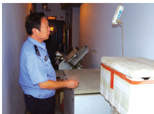
住户冰柜将楼道占去一半